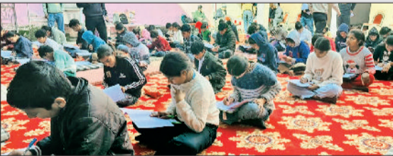
भिवानी। सामान्य ज्ञान प्रतियोगिता में भाग लेते विद्यार्थी।