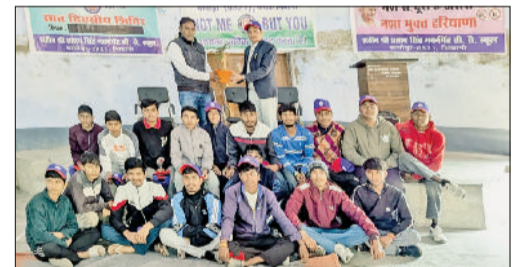
भिवानी। एनएसएस शिविर के समापन पर अतिथि को स्मृति चिन्ह भेंट करते आयोजक।