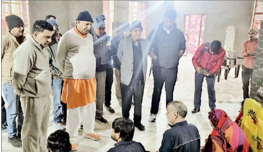
भिवानी। देवीबाई नेत्रहीन दिव्यांग आश्रम में मंचासीन सांसद धर्मबीर सिंह व अन्य अतिथि तथा नेत्रहीनों से मुलाकात करते सांसद धर्मबीर सिंह व अन्य।