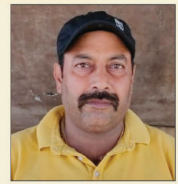
विनोद पंक् पीटीआई, बदलाव की पाठशाला वीर शहीद कैम्पन औप्री दलाल राजकीय उच्च विद्यालय, धुमकानी