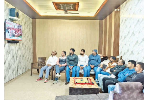
बवानीखेड़ा। पीएम मोदी की मन की बात सुनते हुए।