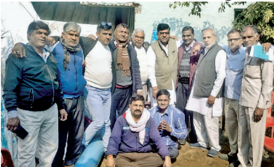
लोहारू। दोनों धार्मिक संगठन के सदस्य एकजुट होकर एक दूसरे को बधाई देते हुए।

लोहारू में धार्मिक और सामाजिक कार्यों में अग्रणी माने जाने वाले श्री श्याम सुंदर ज्योति मंडल और श्री श्याम सेवा समिति ने एकजुट होकर कार्य करने का निर्णय लिया है। इसके लिए दोनों संगठनों के पदाधिकारियों और सदस्यों की आवश्यक बैठक हुई। जिसमें सर्वसम्मति से आगामी समय में रात्रि भजन संध्या, भंडारा और खादू घाम पैदल यात्राएं एकजुट होकर आयोजित करने का निर्णय लिया। उक्त निर्णय की लोहारू के लोगों ने सराहना की है। बता दें कि श्री श्याम सुंदर ज्योति मंडल लोहारू इलाके में पिछले करीब चार दशकों से धार्मिक और सामाजिक कार्य कर रहा है तथा श्री श्याम सुंदर ज्योति मंडल सहयोग से खादू घाम में काफी वर्षों से लोहारू के नाम से धर्मशाला भी