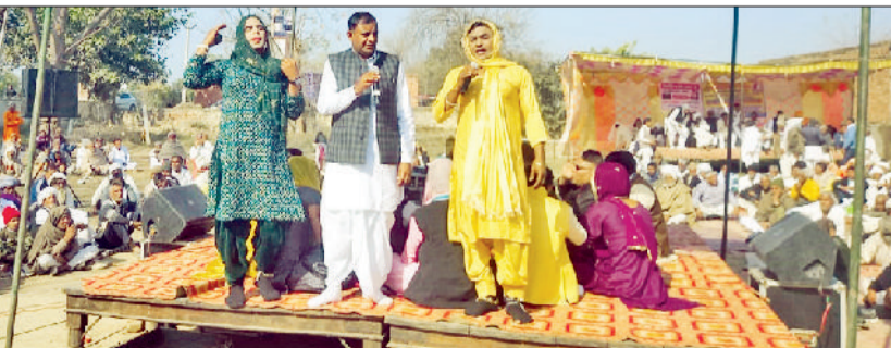
भिवानी। भगत पूर्णमल सांग का मंचन करते कलाकार।

मार्मिक ढंग से बताया कि कैसे वर्षों तक संतानहीन रहे राजा सुलेभान के बाग, गुरु गोरक्षनाथ के आगमन से हरे-भरे हो गए। उन्होंने कहा कि गुरु के आशीर्वाद से बड़ी रानी के घर सुंदर पुत्र 'पूर्णमल' का जन्म हुआ। सांग में मुख्य मोड़ तब आया जब 12 वर्ष का वनवास (गुप्त पालन) काटकर लौटे पूर्णमल को राजा ने अपनी छोटी माता लुनादे के दर्शन करने का आदेश दिया। लुनादे, पूर्णमल की सुंदरता देखकर उन पर मोहित हो गईं और कुटिल प्रस्ताव रखा, जब धर्मपरायण पूर्णमल ने इसे ठुकरा दिया, तो रानी ने षडयंत्र रचकर उन पर ही लांछन लगा दिया। सांग के मंचन के दौरान वह दृश्य सबसे भावुक रहा जब राजा सुलेभान ने अपनी छोटी रानी की बातों में आकर अपने निर्दोष पुत्र को मृत्युदंड का आदेश दिया। कलाकारों के